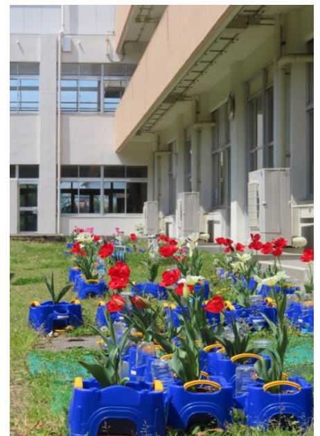
< 中庭に咲いたチューリップ >

4月・5月はであいのステージです。先生や友達との新しい出会いがあります。今日の午前には1年生165人が袋井北小学校入学して、仲間は961人になりました。先生方をあわせると1000人以上です。「友達をもっともっと笑顔にしよう」のスローガンのもと、1000人以上の笑顔が集まるなんて、こんな幸せなことはありません。お互いの関わりを通して友達や先生のすてきなところをいっぱいみつける「であいのステージ」にしましょう。